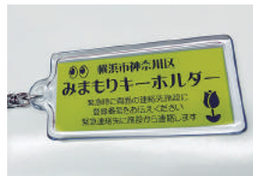
みまもりキーホルダー

認知症による徘徊などで行方不明になる高齢者が急増し、身元確認に繋がる対策が求められています。