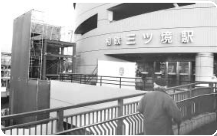
相鉄三ツ境駅(北口)のエレベーター設置工事(H19.12)

三ツ境駅周辺バリアフリー化のひとつである、相鉄線三ツ境駅の上下線ホームと、北口のタクシー乗り場横に設置予定のエレベーター工事が、本年3月の完成に向け、現在急ピッチで行われています。これは、平成15年の決算議会で三ツ境駅周辺を交通バリアフリー基本構想のモデル地区にすべきとの提案によって進められているバリアフリー計画の一環です。完成すれば、高齢者や障害者の皆様をはじめ、多くの方たちの駅利用に貢献していくものと期待されます。