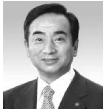
公明党瀬谷支部長 横浜市議員