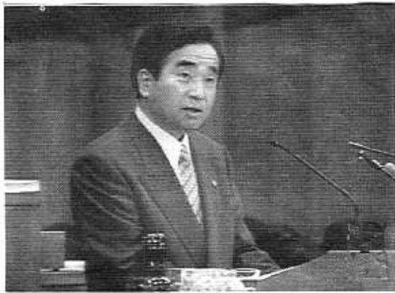
瀬谷駅の南北自由通路設置などバリアフリーを質問・要望する (H12.5 本会議場)