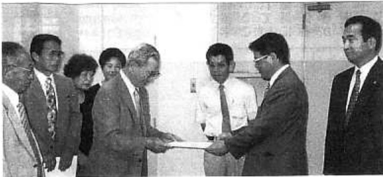
障害者団体や区労連、地元商店街・自治会などの代表と相鉄へ三ツ境駅バリアフリー推進の要望書を届ける（H14.8.27 相鉄本社）