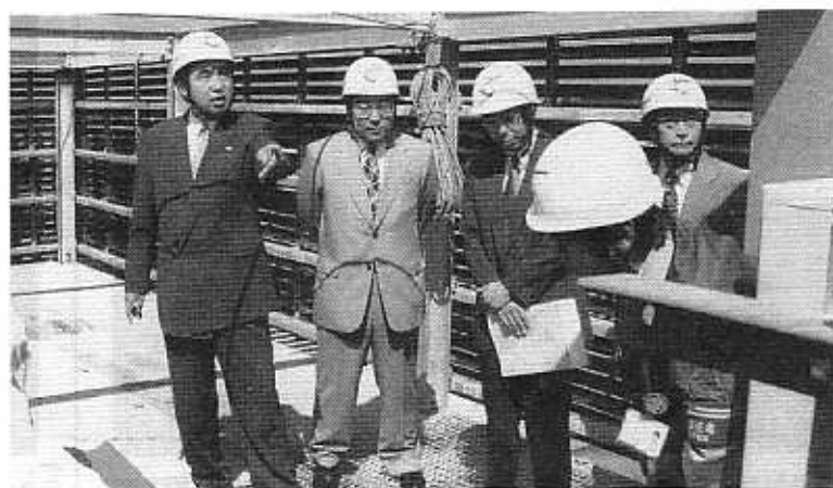
相鉄ライフの屋上でアンテナ設置状況を視察するかのう議員(左)(H12.10)