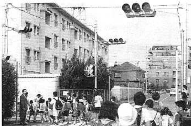
信号機設置後の朝、子供達の登校を見守るかのう議員(左)(H13.9)