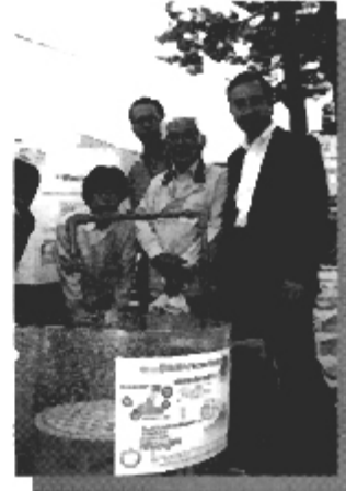
雨水浸透マスの実物