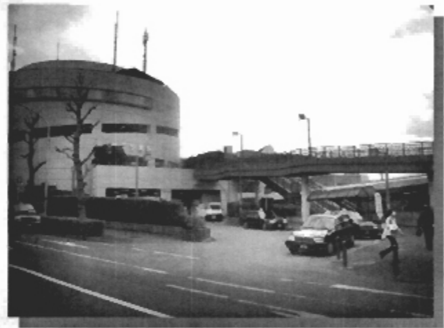
▲設置予定の北口タクシー乗り場付近