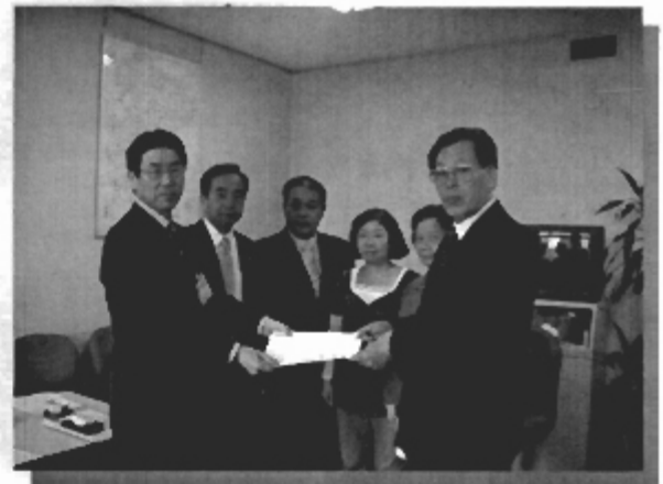
まちづくり調整局長に要望書を提出 (H18.3.7 市庁舎)

調査すると、南台ハイツのトイレのドアの大半が「内開き」になっているため、万が一トイレの内で倒れるなどの緊急事態が発生した場合、ドアを十分に開けることができず、救出が困難な構造になっている事が判明しました。