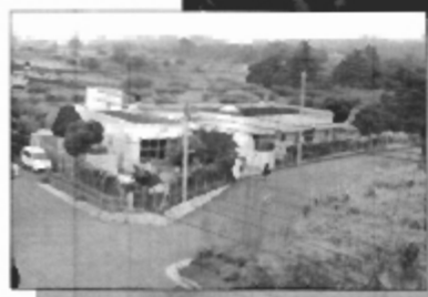
← 細谷戸 保育園前

8街区へつながる区間の整備などで、これにより循環性のあるハイウェイ全体の道路整備が完成に向かいます。