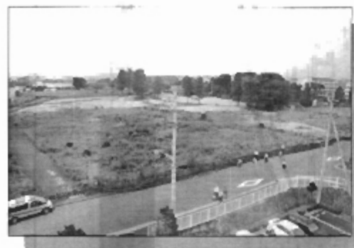
有効活用が望まれる公益地

今後は、現在の整備計画が着実に実施されることを確かめつつ、ハイウェイ全体の中央に位置する広大な公益地の有効活用について、住民の皆様・地域の皆様のご意見を伺いながら、豊かで活力のある住民本位の有益な整備が行われるよう、取り組んでまいります。