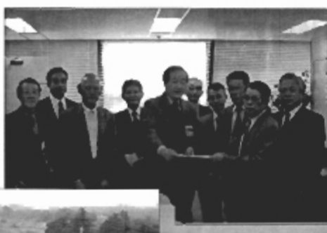
→ 榑崎連合会長他 役員の皆様と陳情